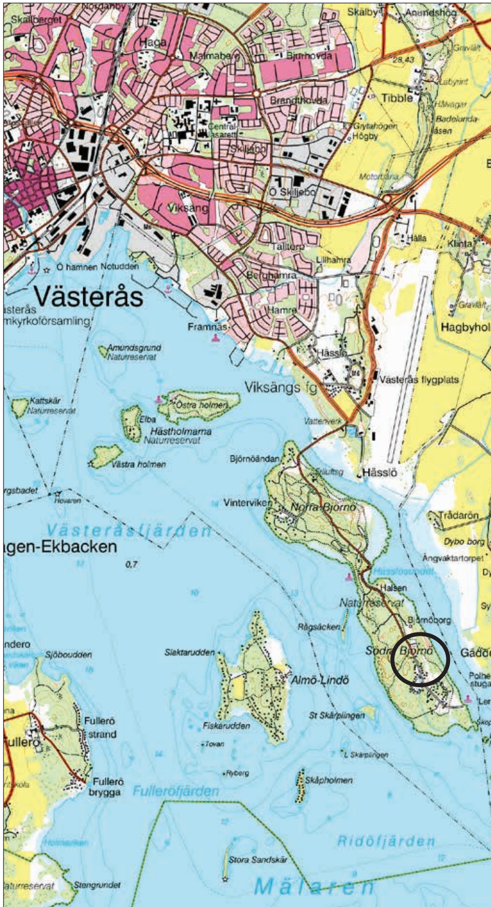
Figur 1. Utdrag ur digitala Gröna kartan. Platsen för den antikvariska kontrollen är markerad med en svart ring. Skala 1:50 000.