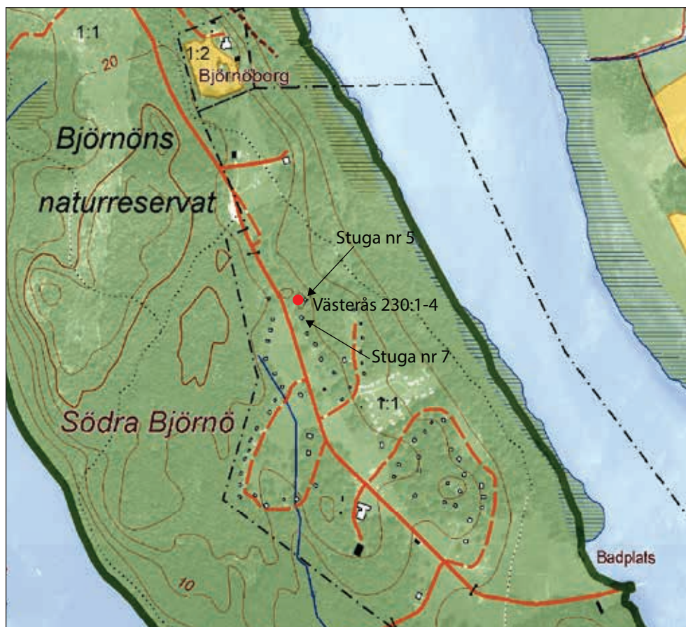
Figur 4. Utdrag ur Fastighetskartan med registrerad fornlämning markerad med rött. Skala 1:10 000.