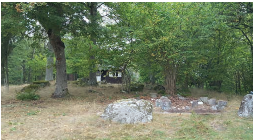
Figur 8, 9 och 10. Lyft och flytt av stuga nummer sju. Fotograferat från söder av Maud Emanuelsson.