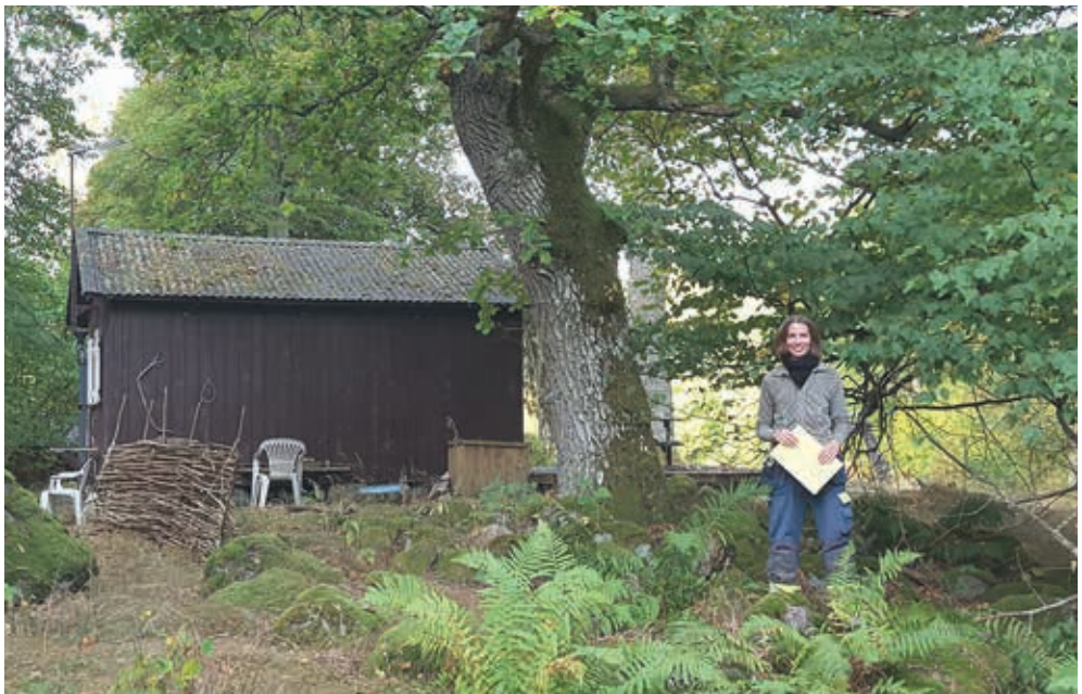
Figur 2 och 3. Stensättning Västerås 230:1 norr om stuga nummer fem. 45 år har passerat mellan fotograferingarna. Det övre fotografiet är taget 1971 av Lars Löthman i samband med ett rekonstreringsarbete för en friluftskarta över Björnön. Det undre fotografiet togs i samband med den arkeologiska kontrollen 2016.