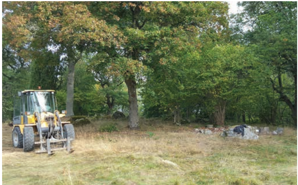
Figur 6 och 7. Stuga nummer fem och sju (i förgrunden) före och efter bortforsling. Fotograferat från söder av Maud Emanuelsson.