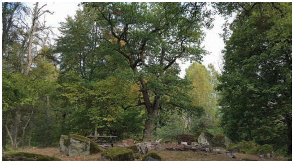
Figur 11, 12 och 13. Lyft av stuga nummer fem. Att flytta denna stuga var komplicerat då framkomligheten för maskinerna var mycket begränsad på grund av stora träd och block. Efter flytten av stugan städades platsen. Syllstenarna ligger kvar. Fotograferat från söder av Mand Emanuelsson.