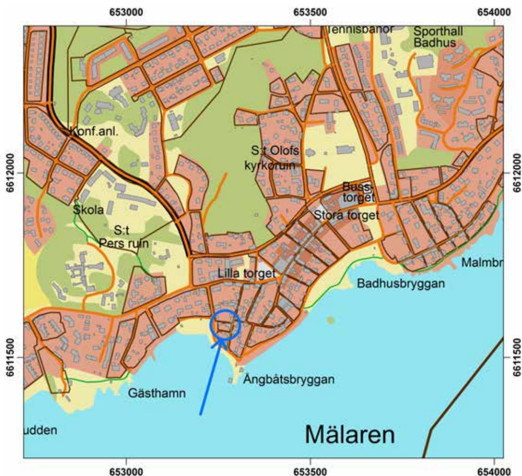
Figur 2. Läget för kvarteret Lillgården är markerat med en blå cirkel och pil. Utdrag ur digitala Fastighetskartan. Skala 1:10 000.