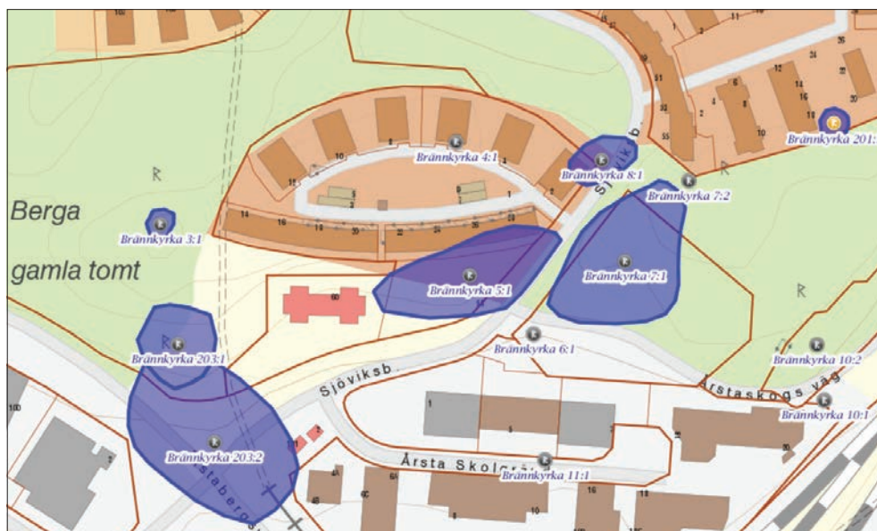
Figur 1. Fornlämningar i området. Brännkyrka 5:1, 6:1, 7:1 och 8:1 utgör det så kallade Bergagravfältet. Utredningsområdet motsvaras av Brännkyrka 5:1. Utdrag ur FMIS, återges här ej skalenligt.

Seniorgården AB har inlett ett detaljplanearbete för delar av fastigheten Årstaberget 1. Stiftelsen Kulturmiljövård (KM) fick förfrågan att genomföra en utredning etapp 1 och 2. Detta innebar att arbetet inleddes med en arkivstudie (etapp 1) på Antikvarisk-topografiska arkivet (ATA), och att fältarbete (etapp 2) skulle genomföras så fort marken var snö- och tjälfri. Fältarbetet i form av etapp 2 kom inte att genomföras då det vid arkivstudien visade sig att nu aktuell yta inom fornlämningen Brännkyrka 5:1 redan var undersökt och borttagen av Stockholms stadsmuseum 2003.