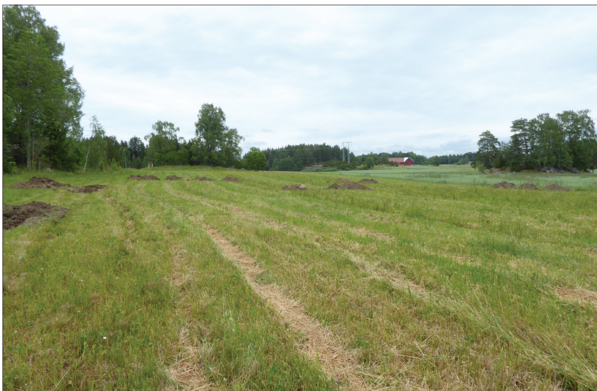
Figur 2. Utredningsområdet sett från sydväst.

Kartor från 1700-talet visar att det löper en väg tvärs över utredningsområdet, från dess sydvästra hörn mot nordöst. Inga spår av vägen syntes vid utredningsschaktningen. Sammanlagt grävdes tio schakt motsvarande omkring 133 m 2 . Inte i något av schakten framkom något av antikvariskt intresse.