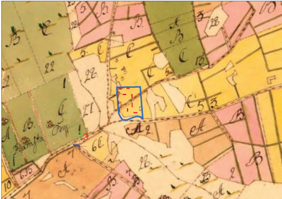
Figur 4. Utdrag ur Storskifteskartan från 1765 där man ser en väg som löper diagonalt genom utredningsområdet (blå polygon).