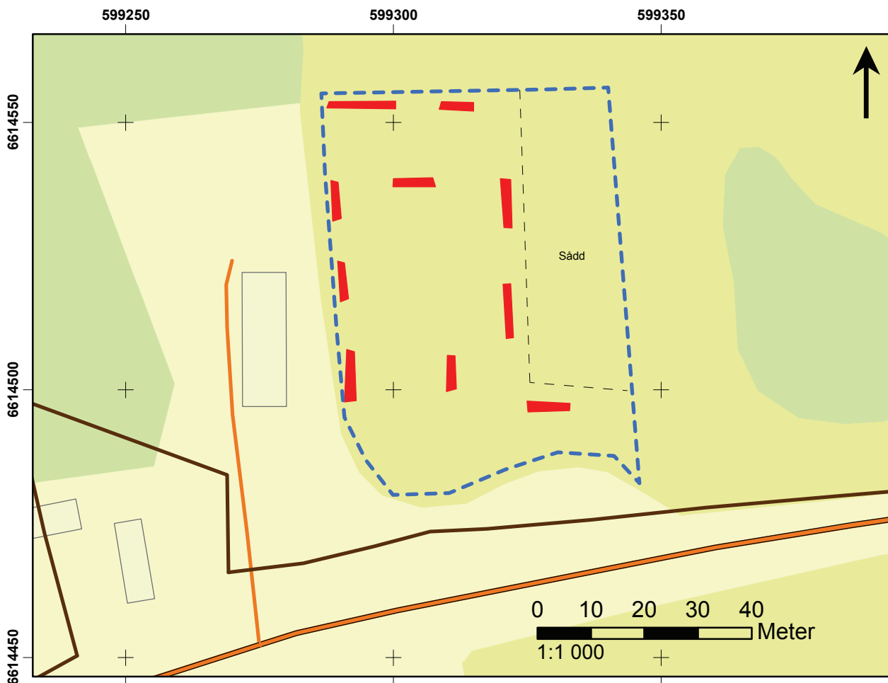
Figur 5. Schaktplan. Utredningsområdet (blå polygon) med de tio grända schakten (röda polygoner). Mätning inlagd på Fastighetskartan. Skala 1:1 000.