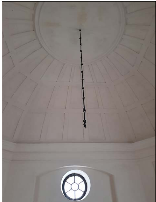
Figur 5–6. Gravkorets interiör som det såg ut hösten 2018. Kapellet's kalkstenshäll kom på plats under 1920-talet. Tidigare fanns en lucka av trä. I gravkoret anordnades ett kolumbarium för askurnor på 1920-talet. Det utsökta kupolvalvet är åttakantigt.