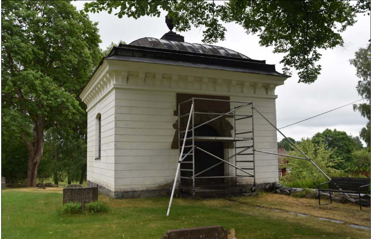
Figur 7. Färna Bockbammars gravkor sommaren 2018. Konservatorns arbete med renovering av dörrömfattningen har påbörjats.