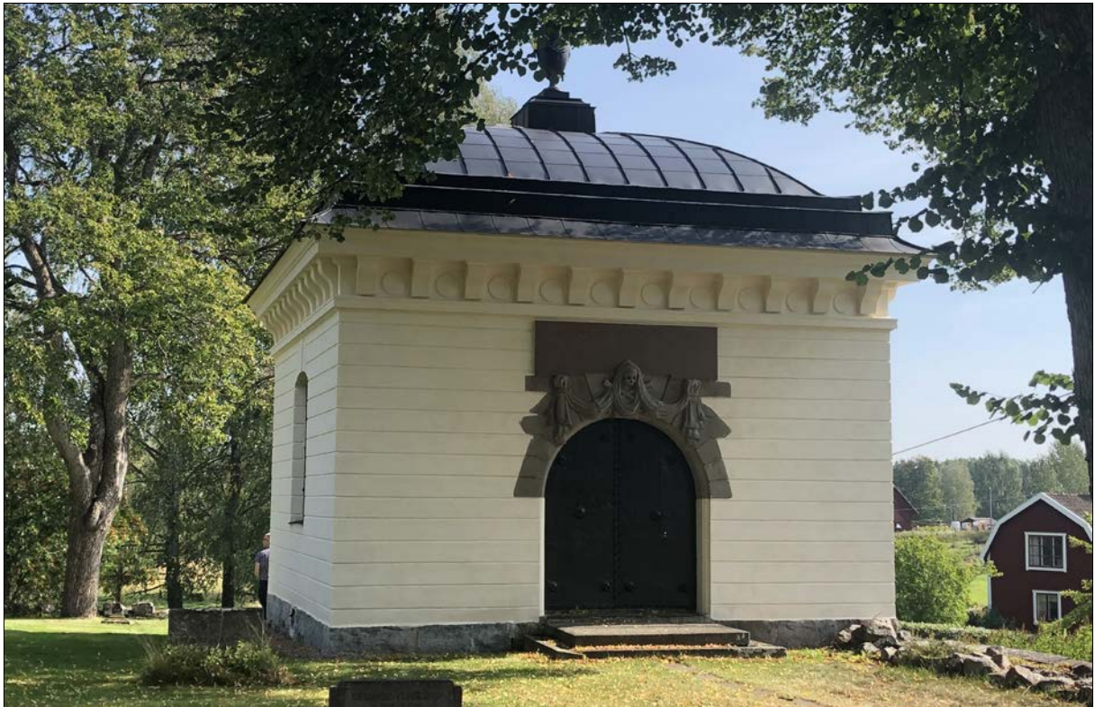
Figur 25. Färna Bockhammars gravkor, slutbesiktning den 28 augusti 2019.