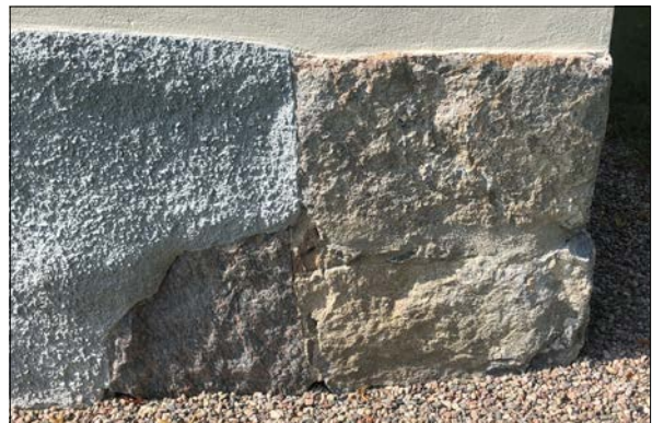
Figur 32. Nyrenoverad sockel, möte mellan spritputs och sten. Marken närmast gravkoret har dränerats.