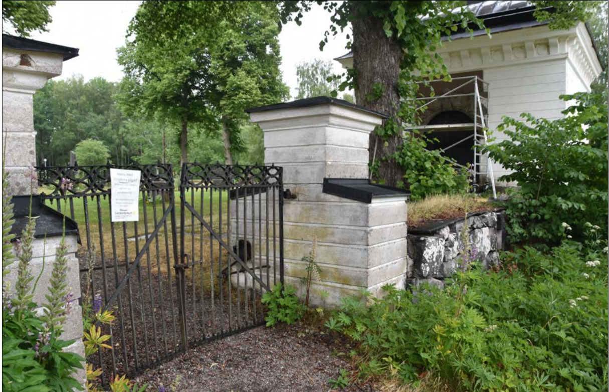
Figur 9. Grindstolpar och grindar före renovering i juni 2018. Lägg märke till marken som var belt täckt med grus.