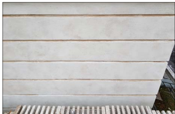
Figur 20. Putsarbeten pågår.