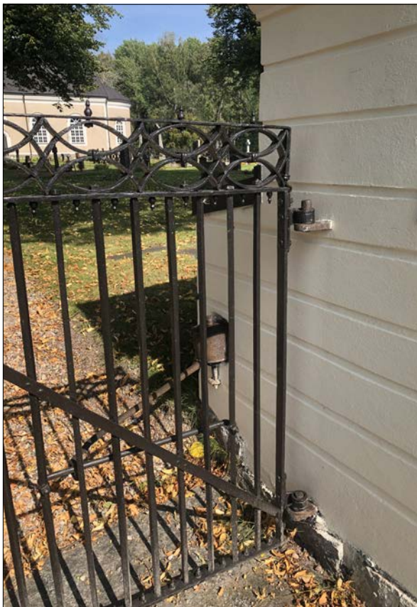
Figur 28. Detalj av grindens gångjärns staplar samt fjäderbelastad stängningsanordning. Även dessa skulle ha renoverats.