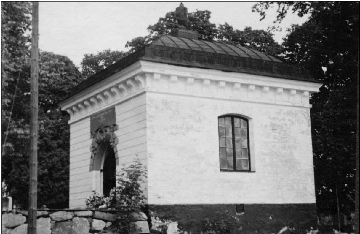
Figur 3. Gravkorets södra fasad 1940.