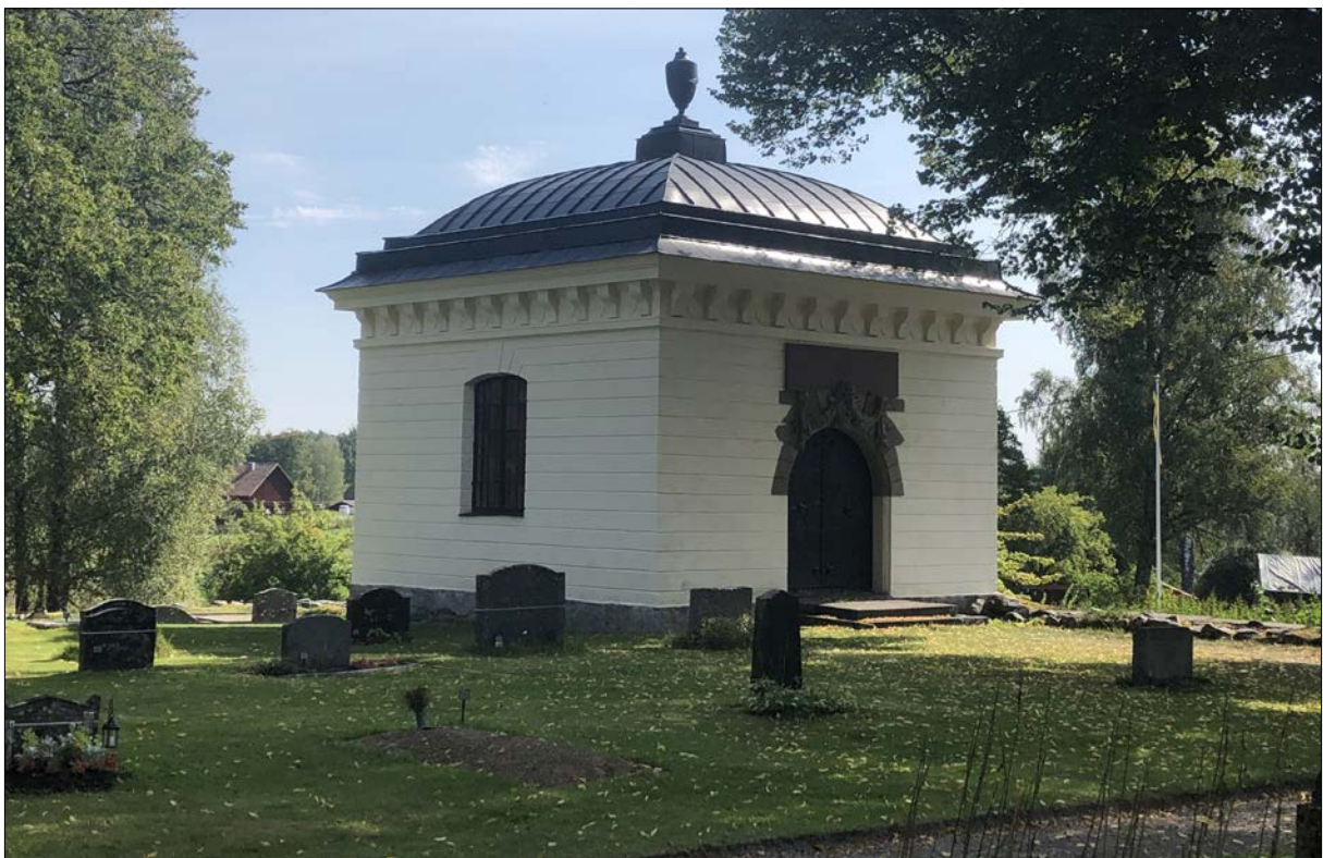
Figur 26. Grankorets norra och västra fasad, sett från kyrkogården.