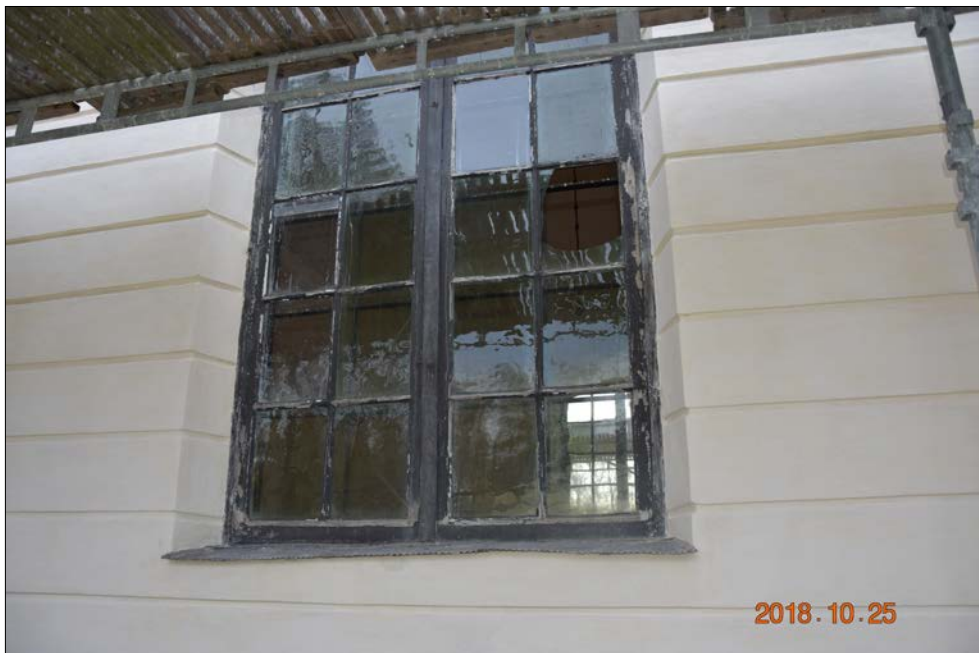
Figur 24. Fasaderna är klara, men fönstren återstår. Norra fasadens fönster före renovering september 2018.