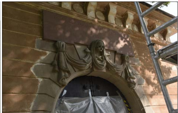
Figur 14–15. Östra och västra fasaden efter blästring. Konservatorn har avslutat sitt arbete, augusti 2018.