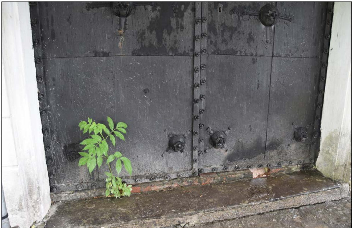
Figur 8. Entrédörrens nedre del är angripen av korrosion och färgen har flagnat. Dörrens dekor har på flera ställen rostangrepp.