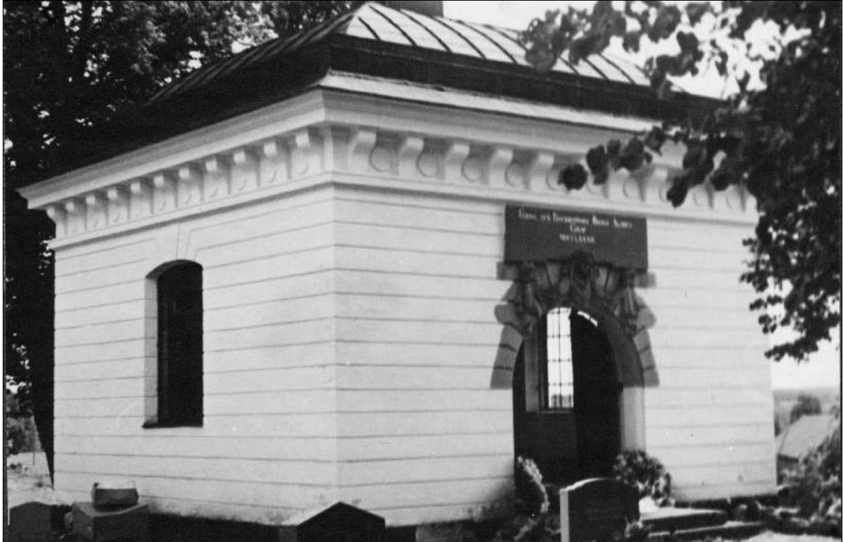
Figur 2. Äldre fotografi från 1940 av Färna Bockhammars gravkor. Lägg märke till inskriptionen med förgyllda bokstäver.