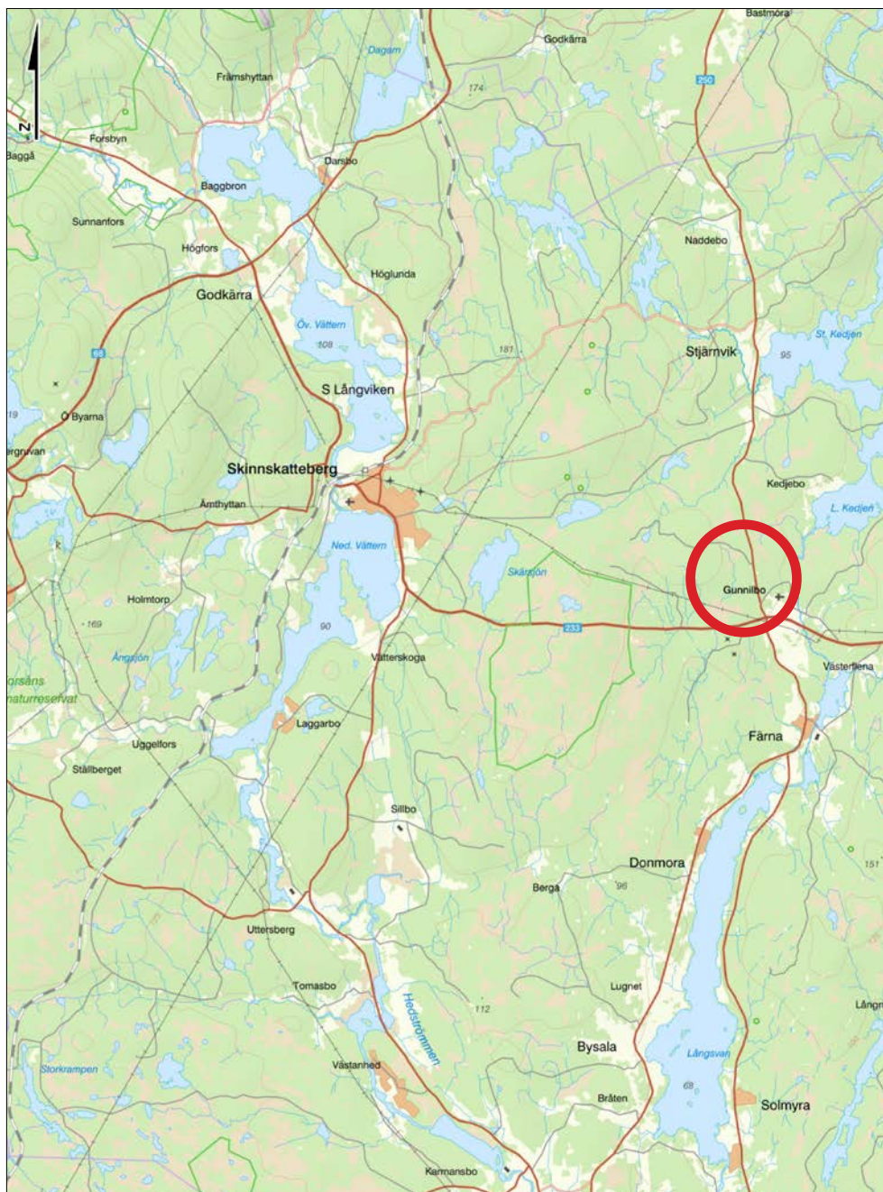
Figur 1. Grankoret är beläget vid Gunnilbo kyrka. Utdrag ur Länsstyrelsens WebbGis.