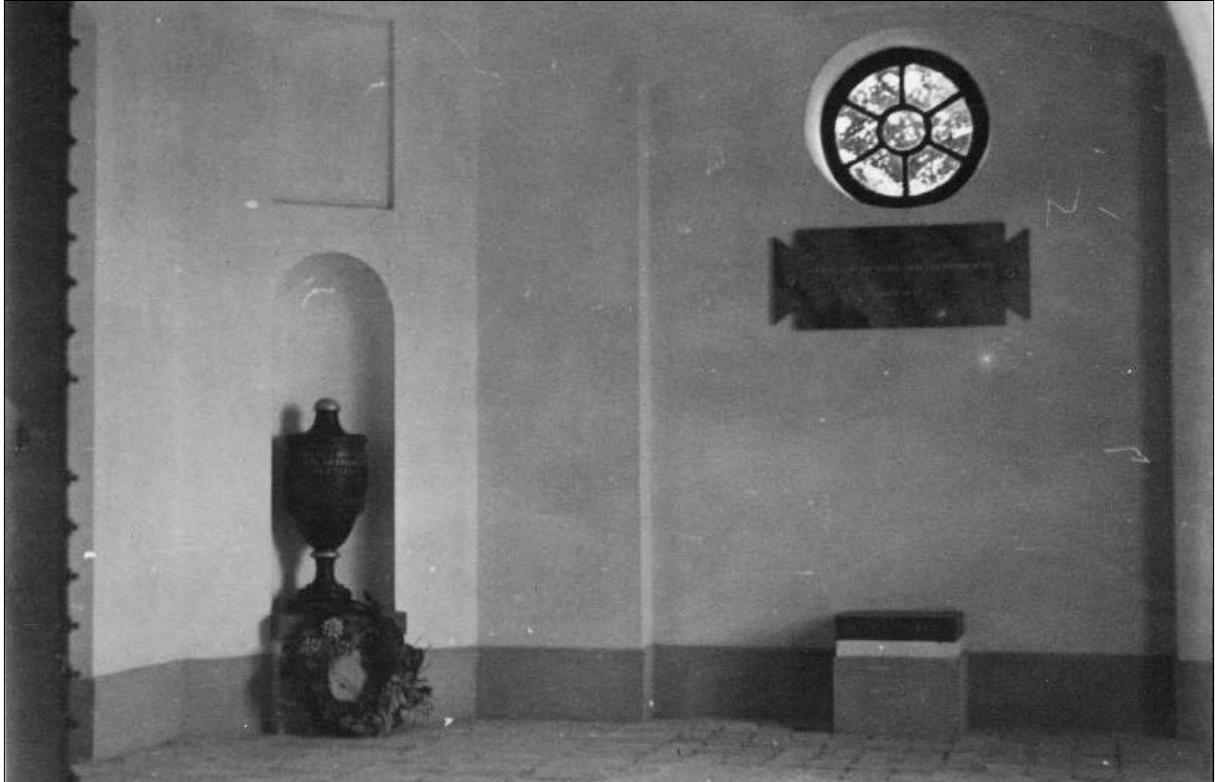
Figur 4. Gravkorets interiör som det såg ut 1940.