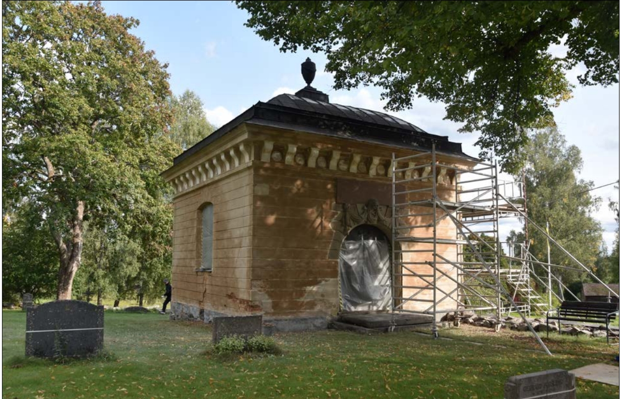
Figur 13. Gravkoret efter blästring, västra och norra fasaden.