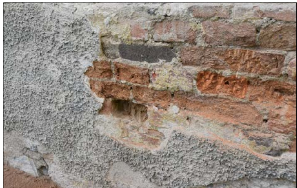
Figur 16–17. Detalj av norra fasaden samt sockeln på östra fasaden efter blästring.