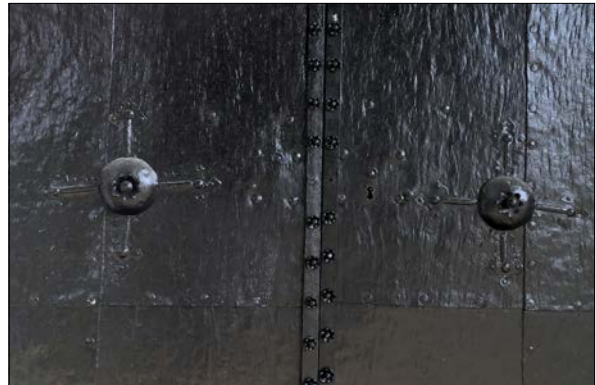
Figur 30. Detalj av entréport.