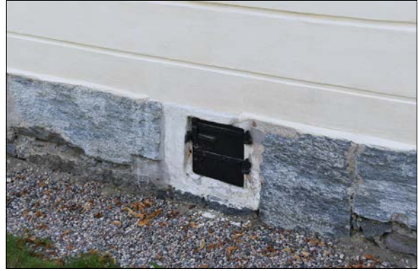
Figur 29. Detalj av renoverad järnlucka målad med svart linoljafärg.