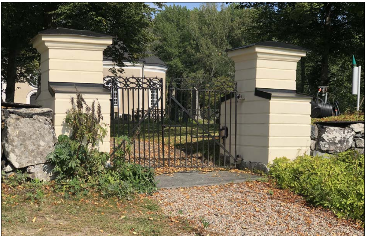
Figur 37. Nyrenoverade grindar och grindstolpar.