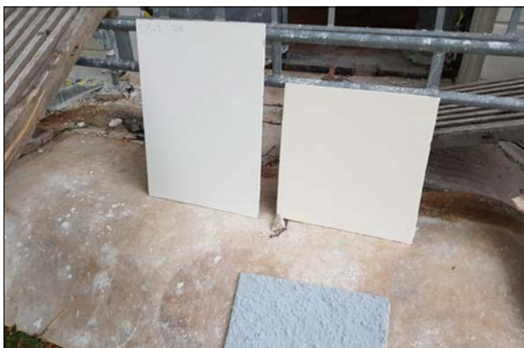
Figur 19. Färgsättningsprover, september 2018.