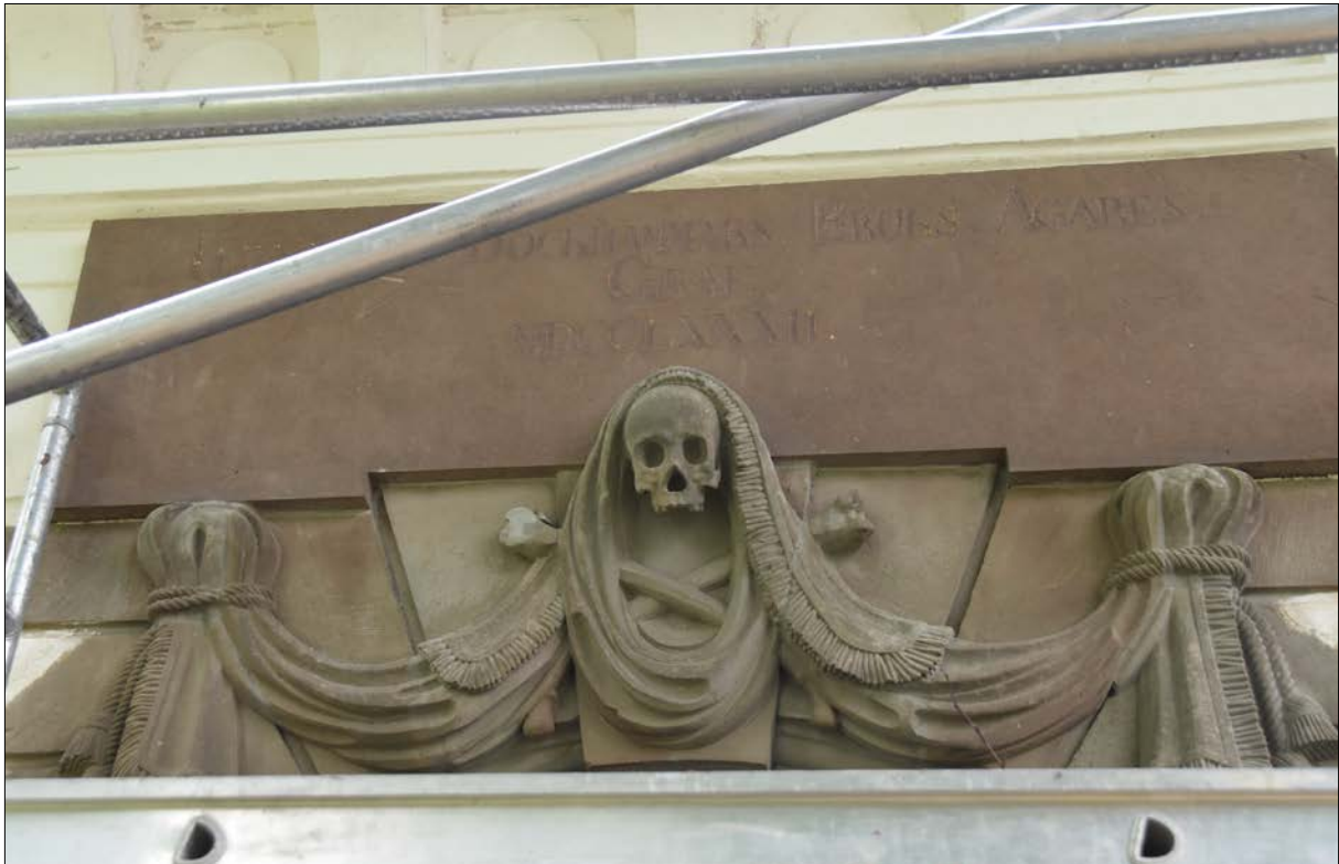
Figur 11. Avstämmingsmöte den 10 juni 2018. Konservatorns arbete med portalen pågår. Lägg märke till inskriptionstavlan i röd sandsten. Ursprungligen var texten förgylld. Önskvärt vore om texten åter förgylldes. Tyvärr ingår inte förgyllning i denna renovering.