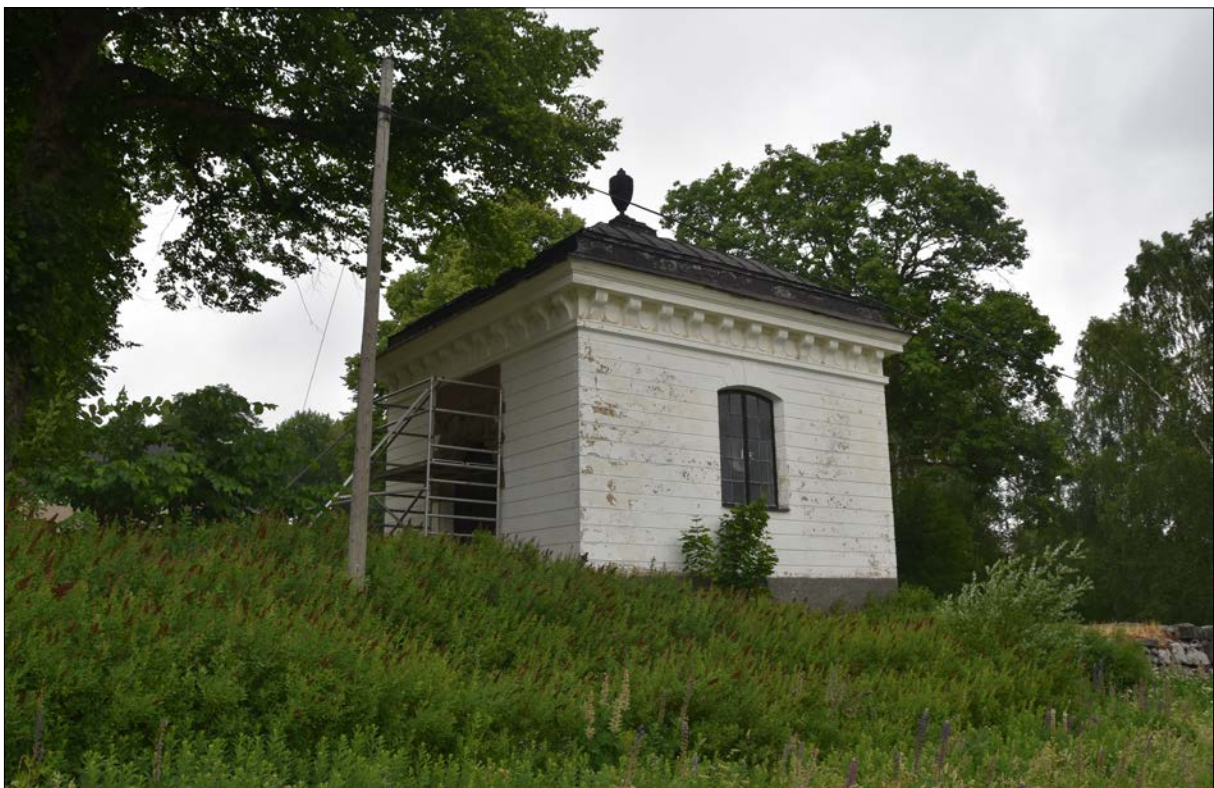
Figur 12. Västra och södra fasaden i juni 2018.