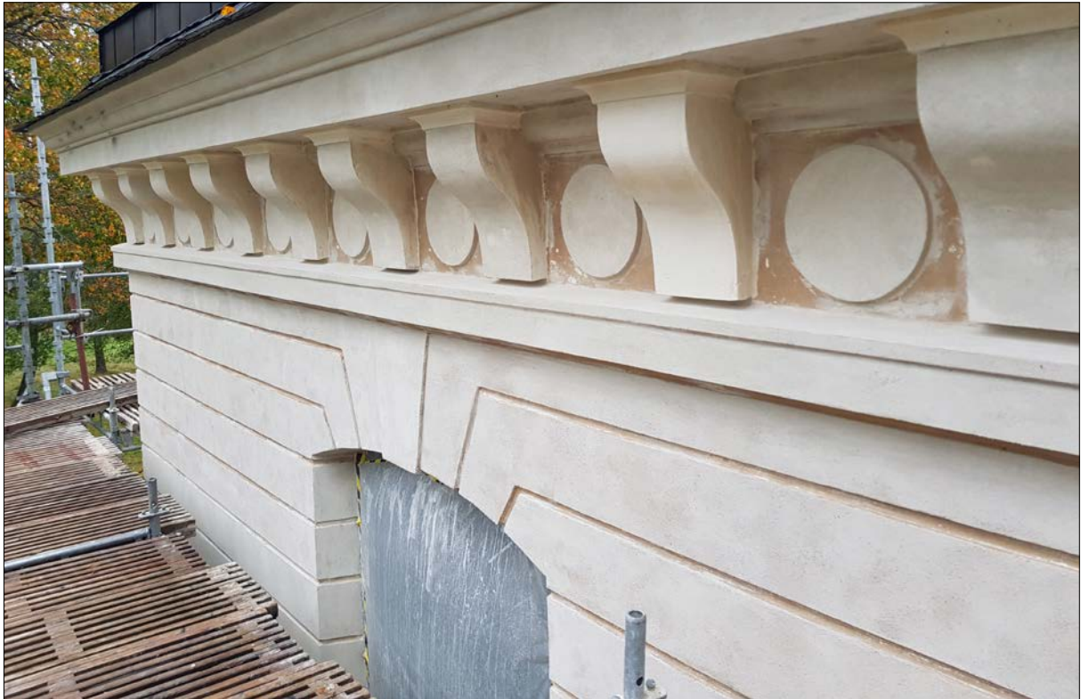
Figur 18. Ett äldre färgskikt föranledde beslut om att ändra färgsättningen.