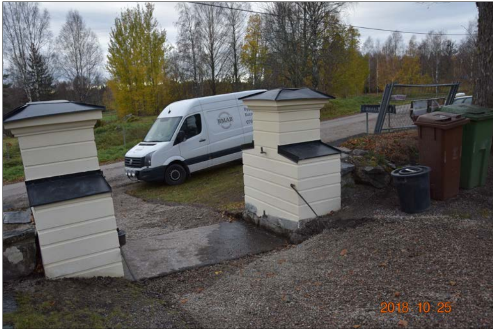
Figur 23. Grindstolparna är klara! Det visade sig att under alla grusmängder fanns en stenhäll mellan grindstolparna.