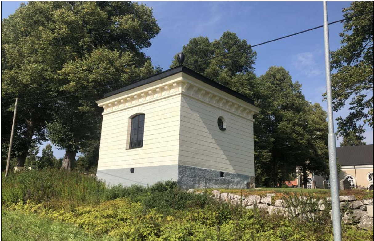
Figur 36. Gravkorets södra och östra fasad sett från vägen. I bakgrunden skymtar Gunnilbo kyrka.