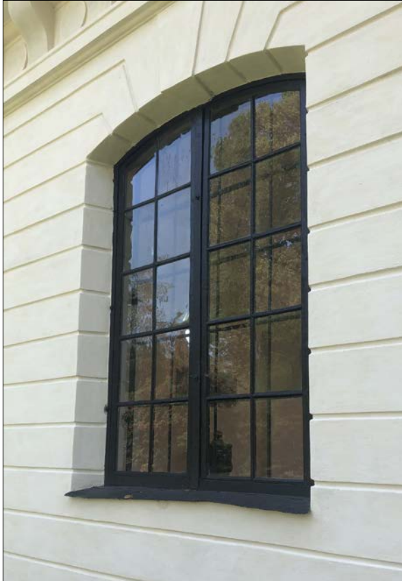
Figur 27. Nyrenoverat fönster på norra fasaden som bevarar ursprungligt fönsterbleck. Flertalet glas är ursprungliga.