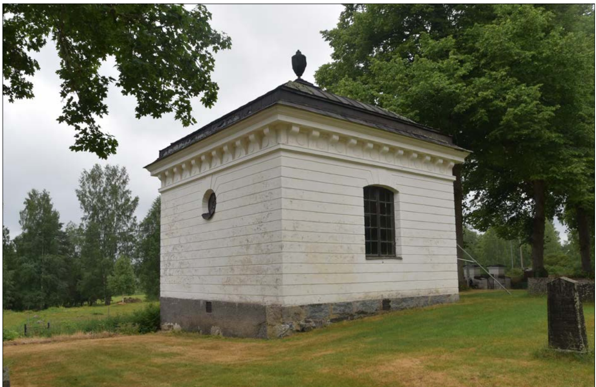
Figur 10. Östra och norra fasaden i juni 2018 före renovering.