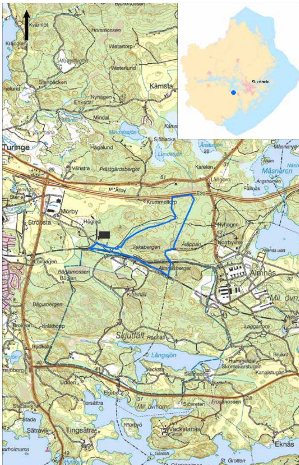
Figur 1. Utredningsområdet markerat med en blå polygon. Utdrag ur digitala Terrängkartan. Skala 1:50 000.