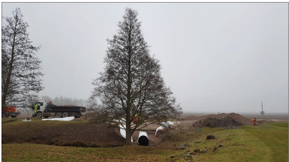
Figur 9. Vägtrumman är bytt och schaktet håller på att fyllas igen. Foto från norr.