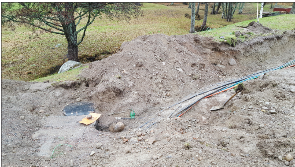
Figur 6. Kablage med tillhörande jordbrunnar ovanpå vägtrumman komplicerade arbetet. Foto från sydväst.