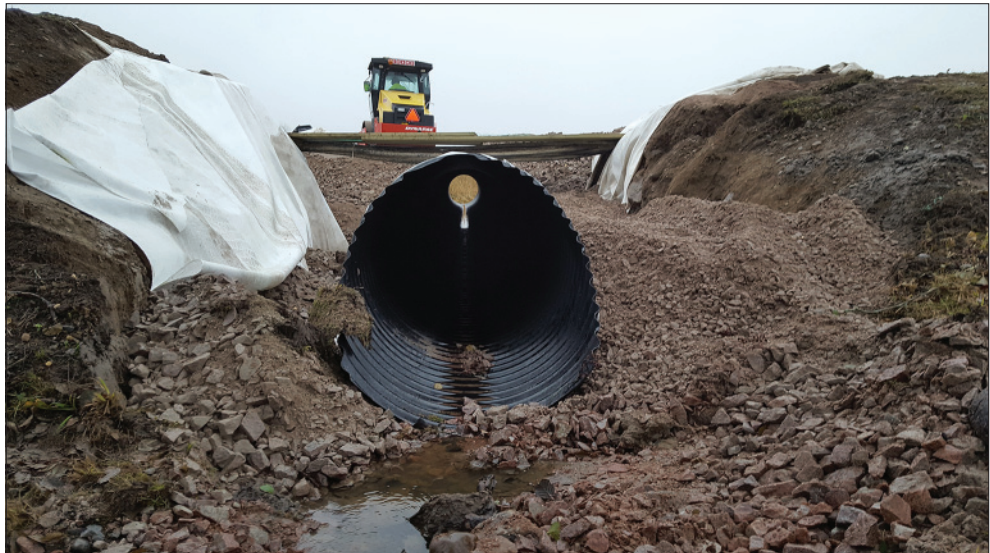
Figur 8. Den nya vägtrumman och del av det grävda schaktet. Foto från norr.