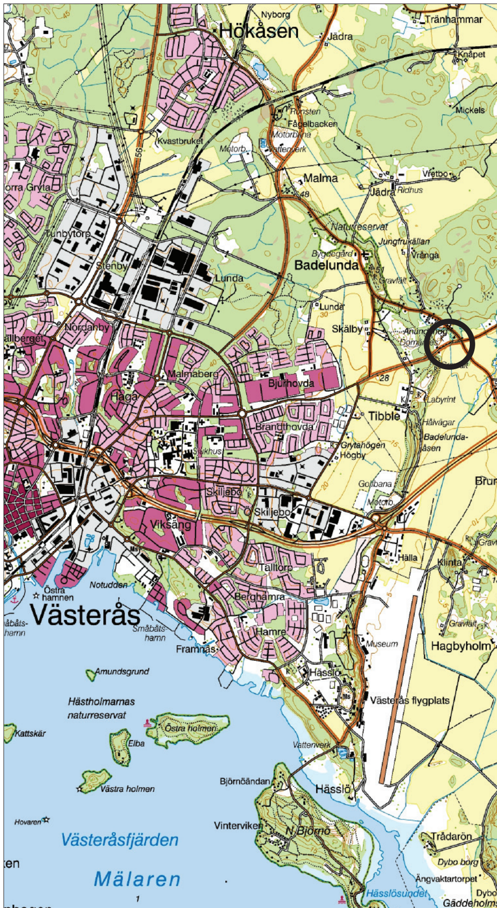
Figur 1. Platsen för den arkeologiska kontrollen är markerad med en svart ring. Utdrag ur Terrängkartan. Skala 1:50 000.