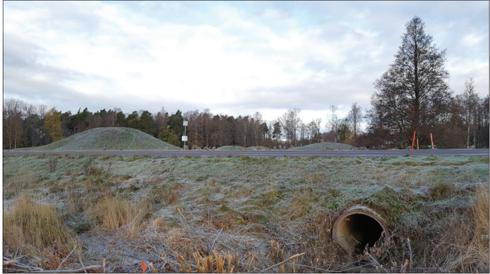
Figur 7. Den äldre vägtrumman under väg U692 före schaktning och byte. Foto från söder.