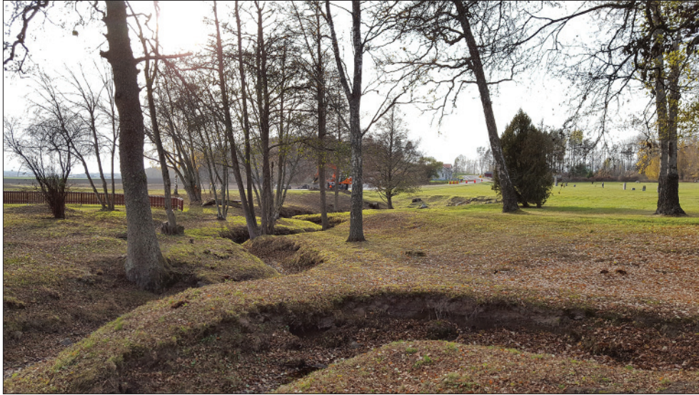
Figur 4. Långbybäcken. Den äldre vägtrumman anas till höger om grävmaskinen. Foto från nordost.