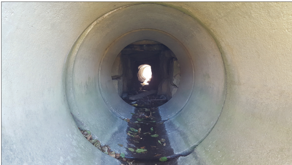
Figur 5. Den äldre vägtrumman var byggd av cementrör och en stenbro. Foto från norr.