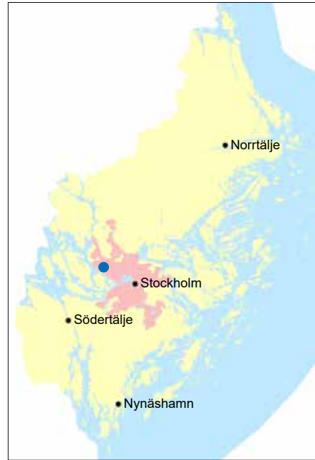
Figur 1. Undersökningsområdet markerat med en blå ring. Utdrag ur Terrängkartan. Skala 1:50 000.