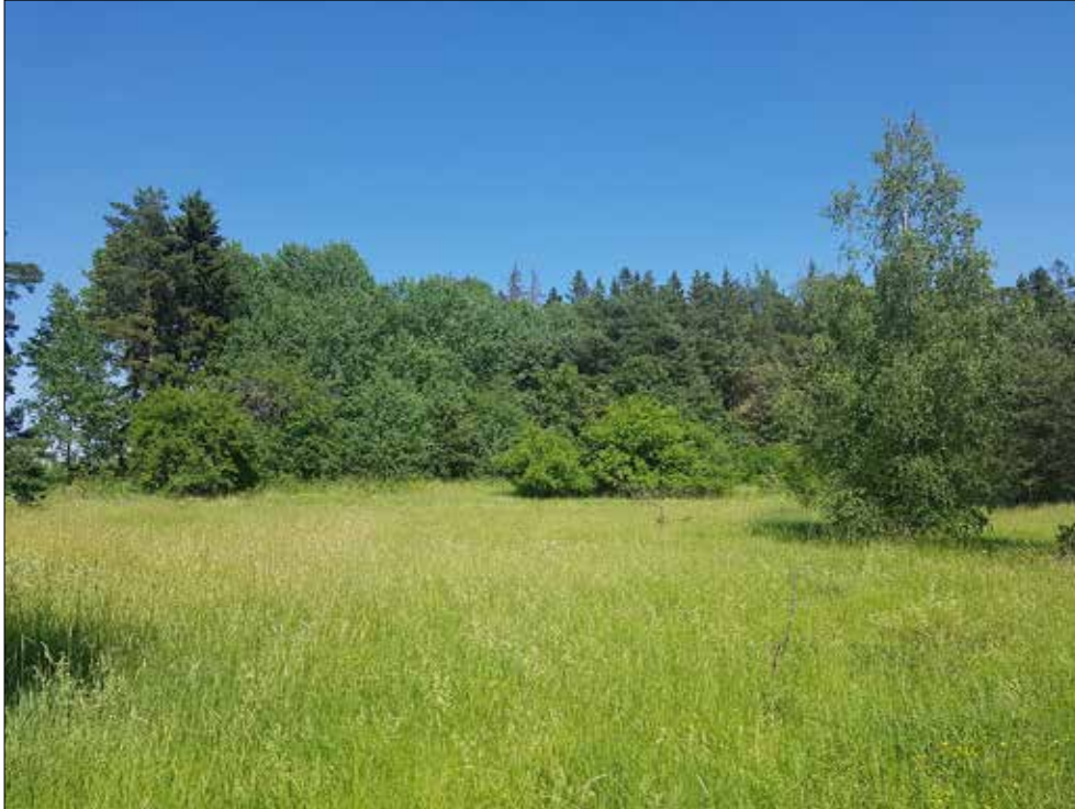
Figur 3. Undersökningsområdets centrala del från sydväst.