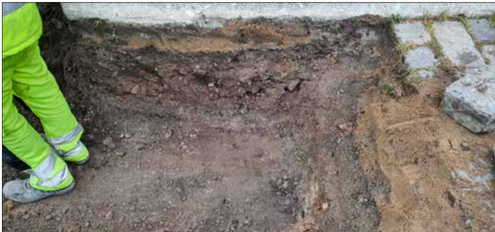
Figur 5. Den östra änden av schaktet. Under kullerstenarna syns ett tunt bärlager följt av det grusiga utfyllnads-lagret med tegelkross. Foto från väster.