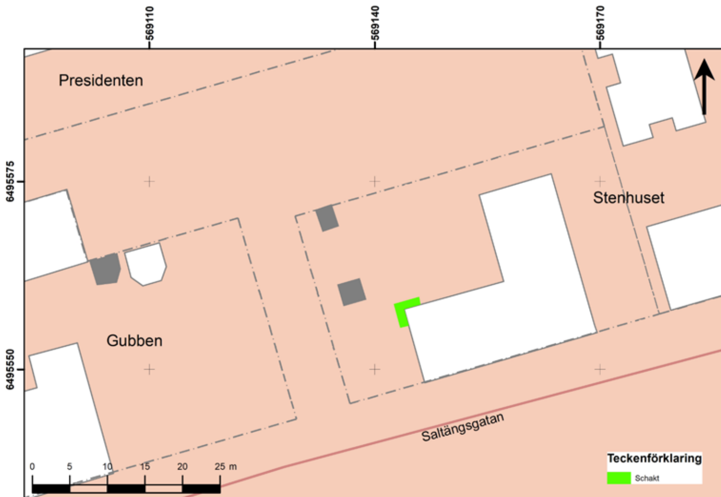
Figur 3. Schaket i Saltängsgatan 19. Utdrag ur Fastighetskartan. Skala 1:5 000.

då Nya Staden. I denna del av staden, som kom att bli stadens bättre område fram till 1800-talet, uppfördes bland annat Louis De Geers palats Stenhuset 1627 och Gamla Tullhuset 1784. Det utlovades flera frikostiga förmåner av hertig Johan i form av tolv års skattefrihet åt dem som bosatte sig där. I övergången till 1900-talet hade området fått ett mycket dåligt rykte varpå en stor del av den äldre bebyggelsen revs och ersattes av parkeringsplatser och kontorskomplex, framför allt under andra halvan av 1900-talet (Carlsson 2012:8).