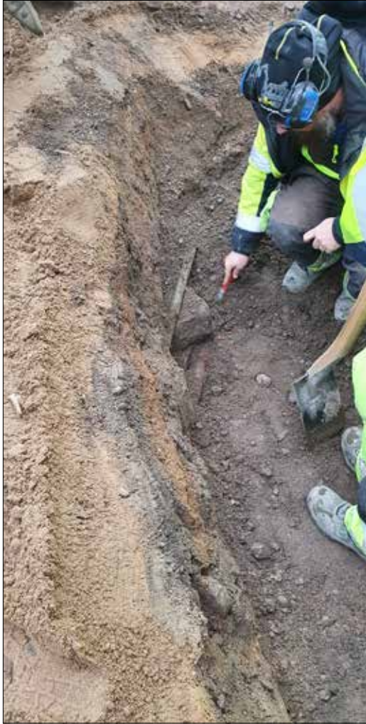
Figur 4. Två stålrör och en huggen sten påträffades i det nordvästra hörnet av schaktet. Foto från söder.