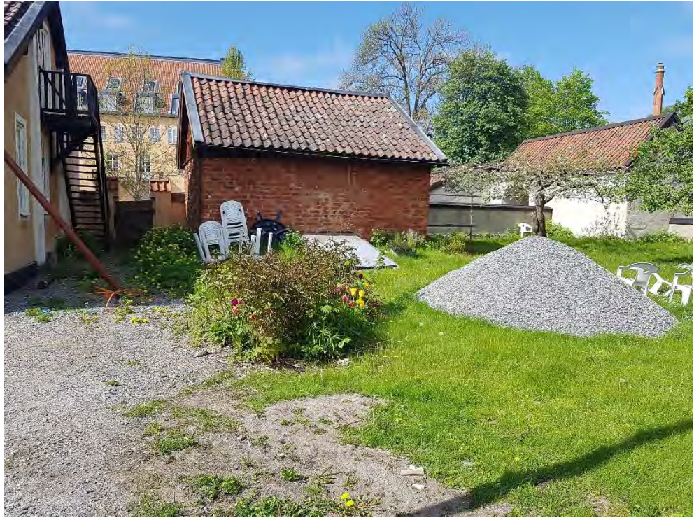
Figur 19. Befintlig rabatt.