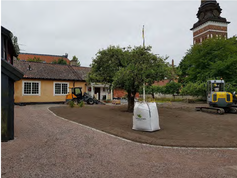
Figur 25. Ny kantsten mellan grusad yta och gräsmatta.