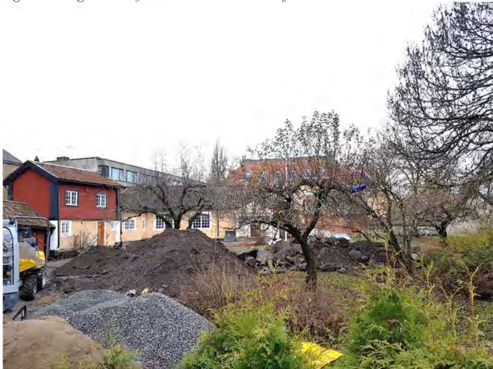
Figur 16. Trädgården sedd från öster hösten 2019.