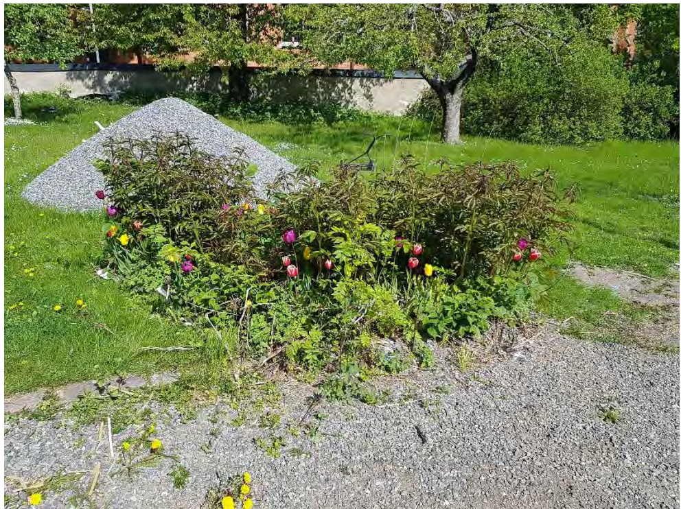
Figur 20. Befintlig rabatt.