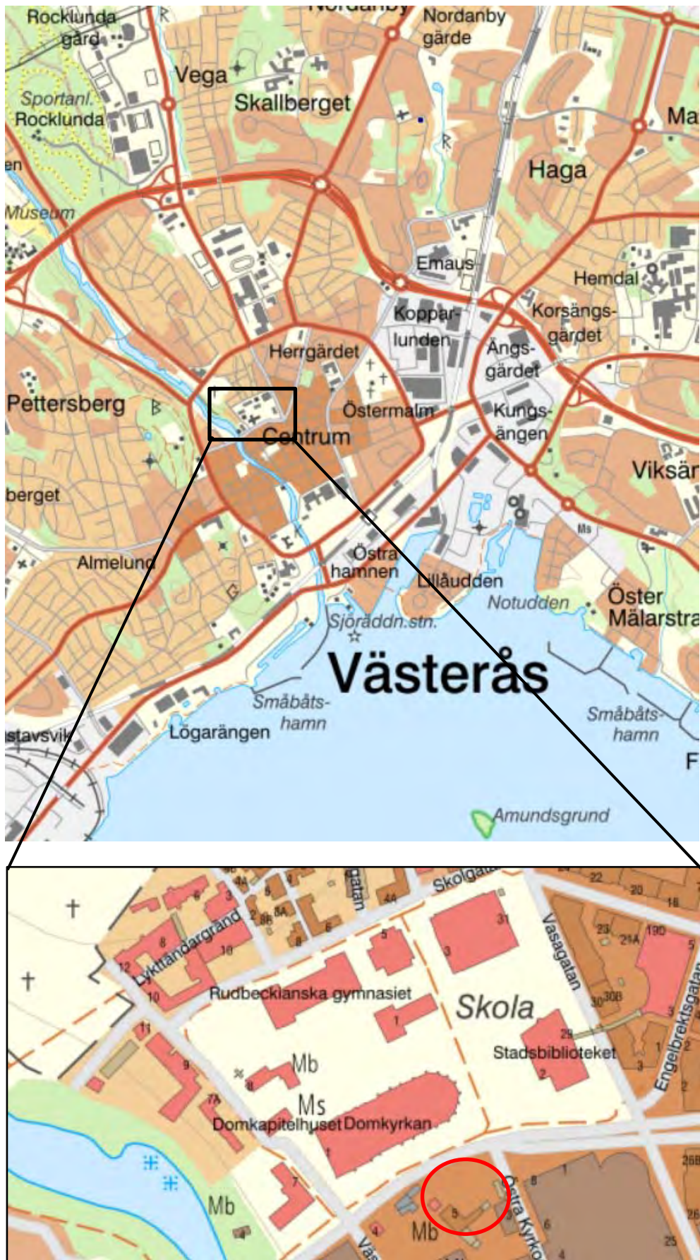
Figur 1. Komministergårdens läge, markerat med en ring.