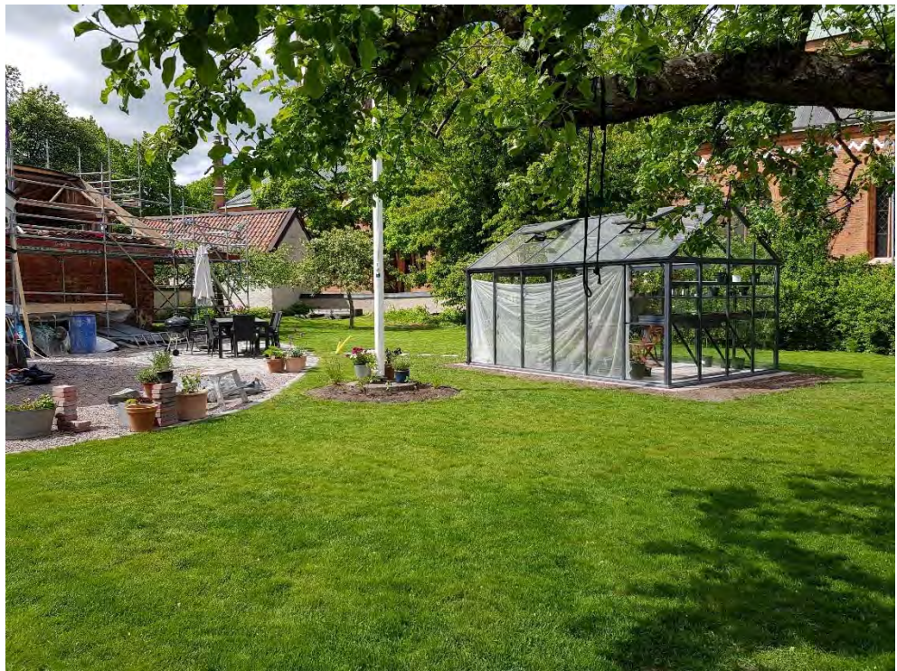
Figur 28. Nytt växthus.