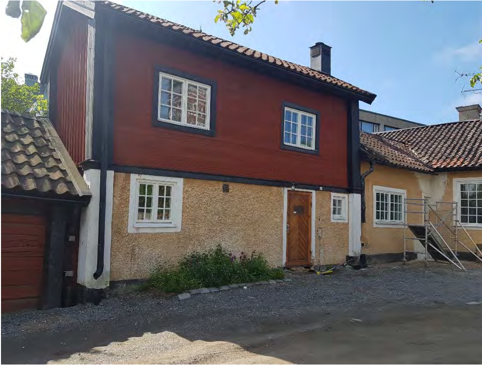
Figur 21. Befintlig rabatt.