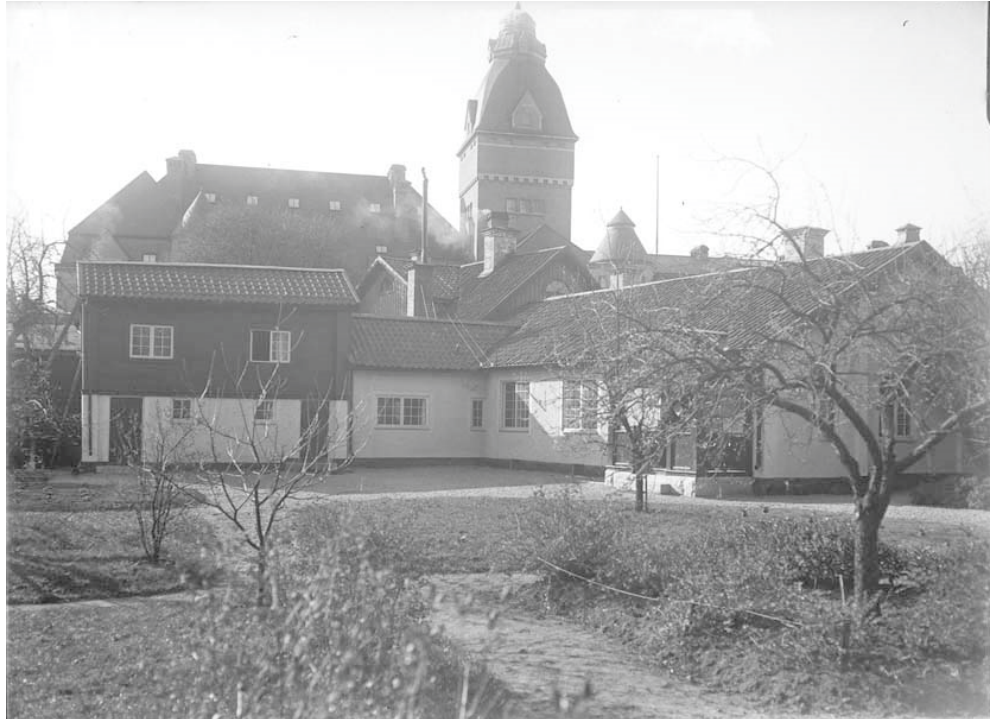
Figur 4. Trädgården efter Habrs renovering, troligen under 1910 eller 1920-talet, sett från norr. Sandgångssystem samt en större grusad yta framför huset. Frukträd, gräsytor och planteringar i trädgården men ingenting utefter fasaderna.