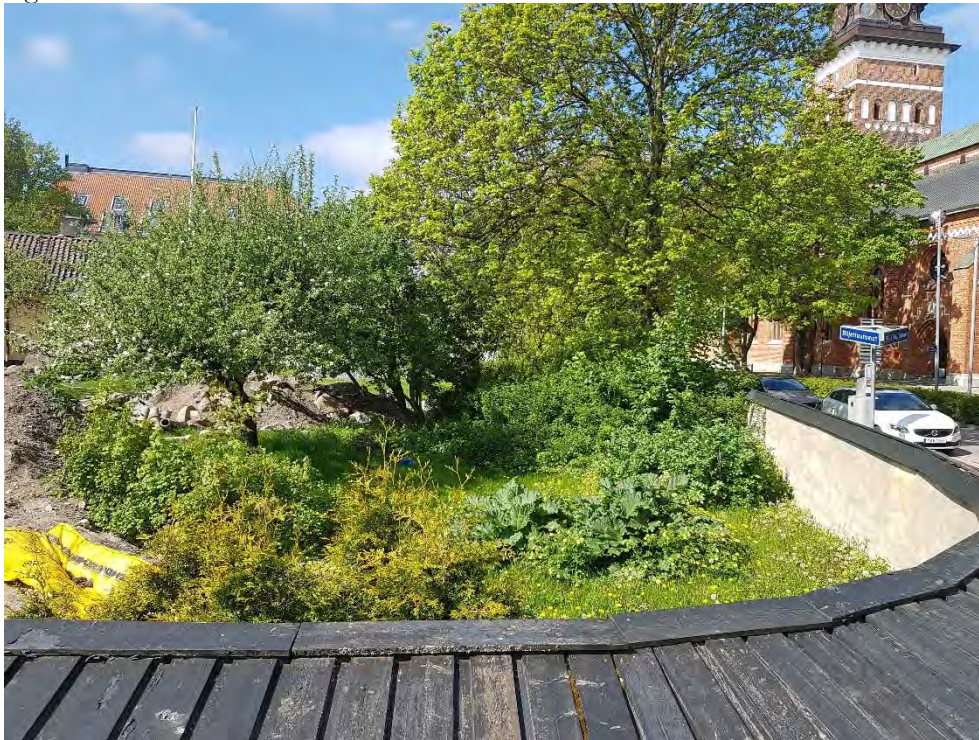
Figur 18.