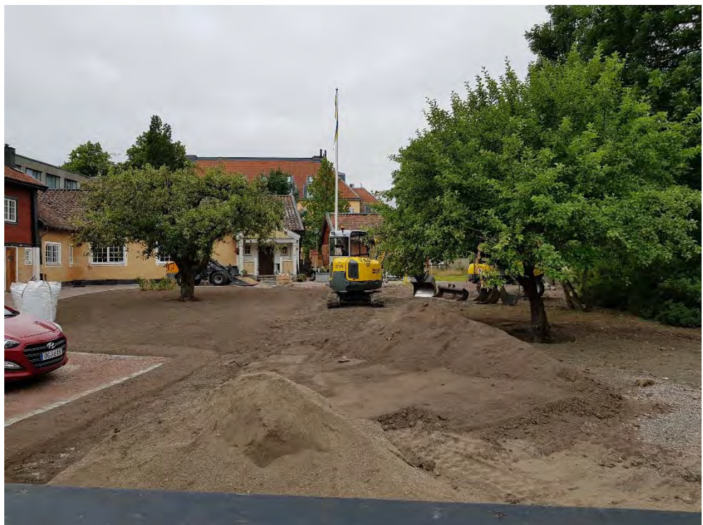
Figur 24. Kantsten vid ny parkeringsyta till vänster i bild.. Utjämning av svackor.