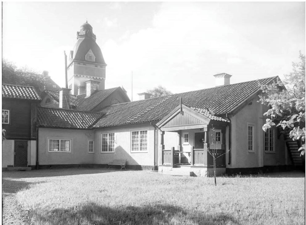
Figur 5. Trädgården efter Habrs renovering, troligen under 1910-talet, sett från nordöst. Sandgångssystem samt en större grusad yta framför huset. I jämförelse med figur 4 är fruktträdet i närheten av verandan relativt nyplanterat.