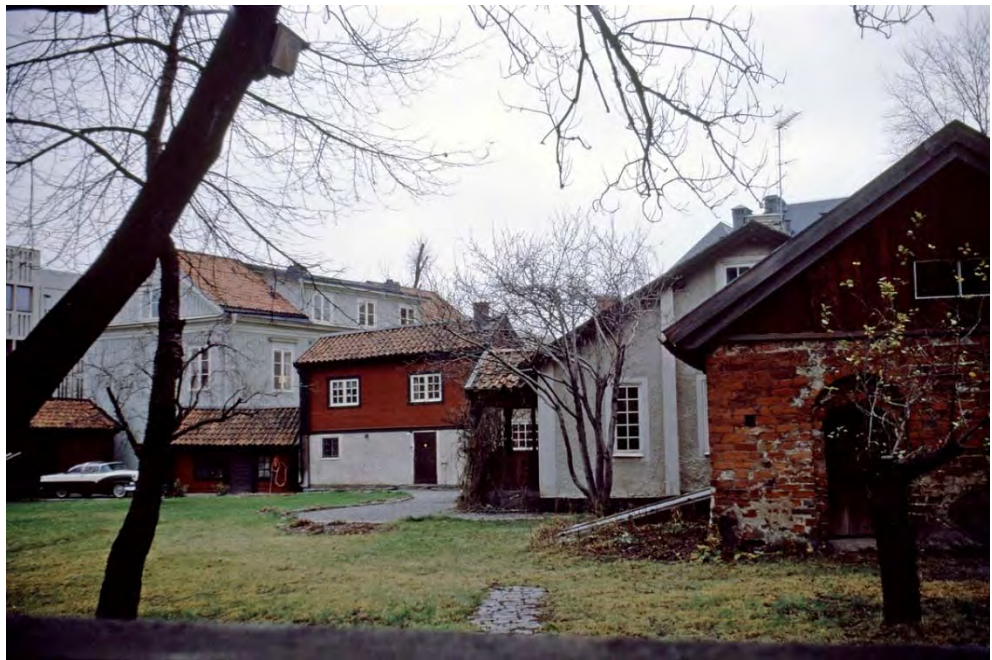
Figur 9. Komministergården, troligen på 1960- eller 1970-talet.