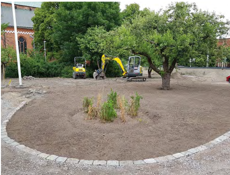
Figur 26. Ny stensatt kant och rabatt. .