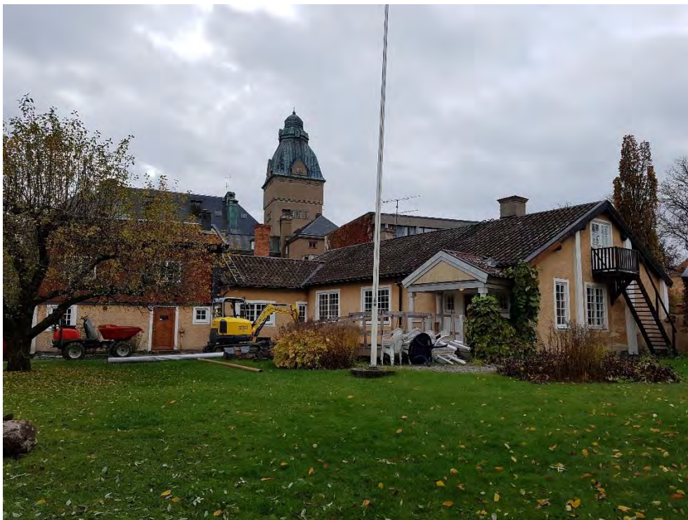
Figur 14. Trädgården sedd från nordöst hösten 2019.