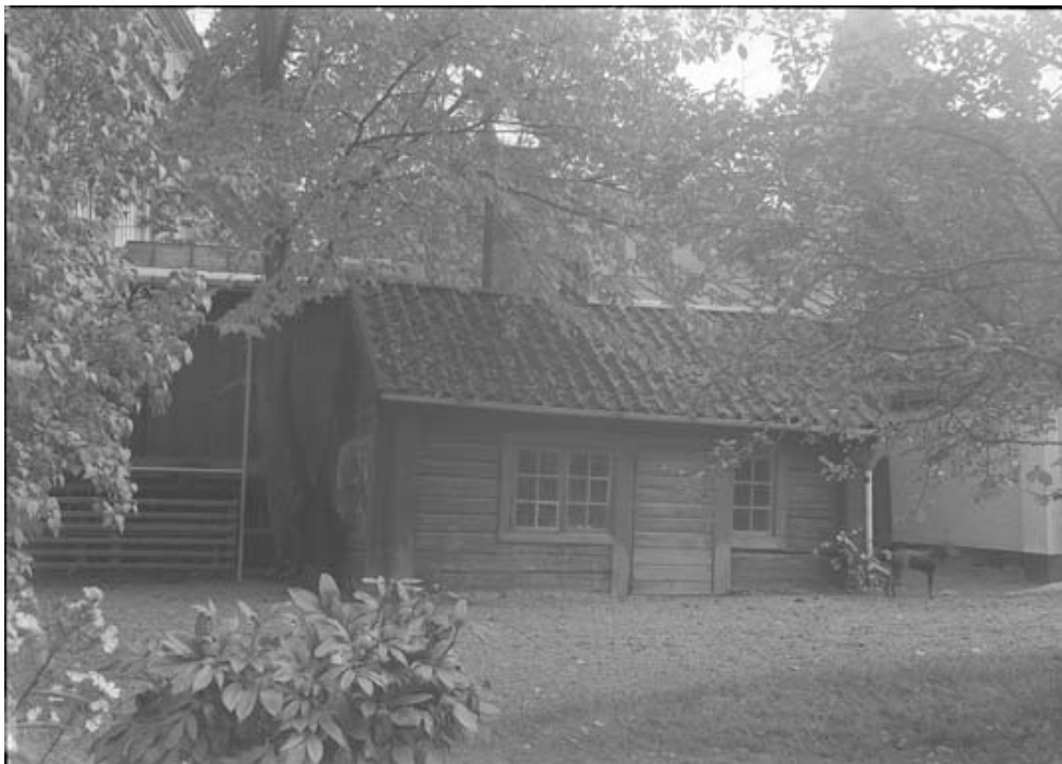
Figur 7. Brygghuset på komministergårdens tomt på 1930-talet.