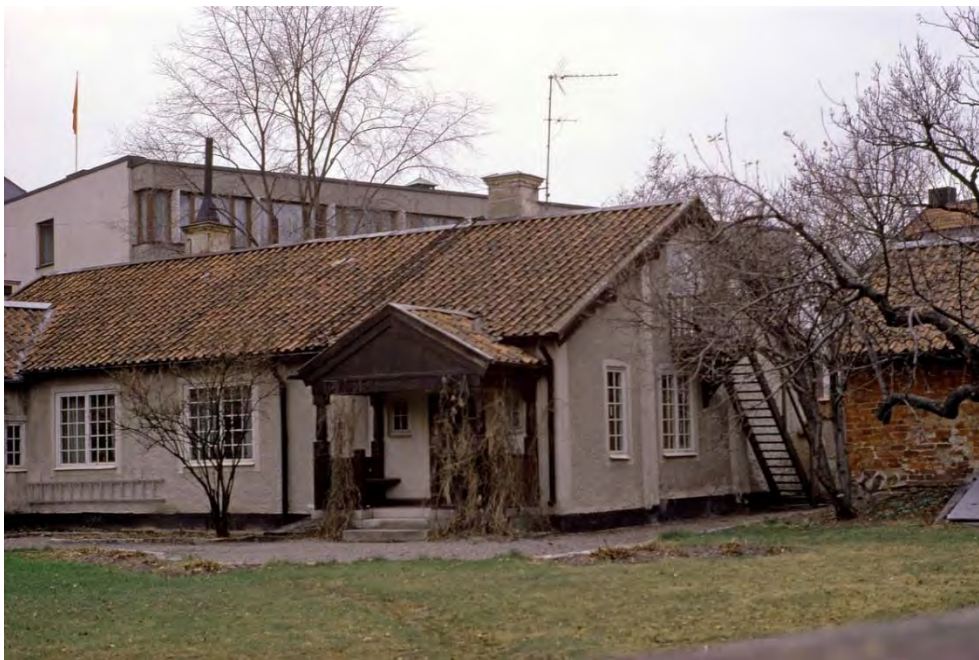
Figur 10. Komministergården, troligen på 1960- eller 1970-talet.