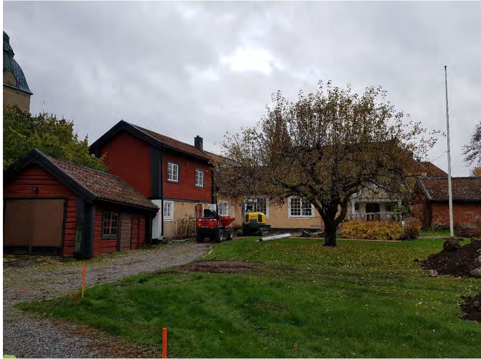
Figur 15. Trädgården sedd från öster hösten 2019.