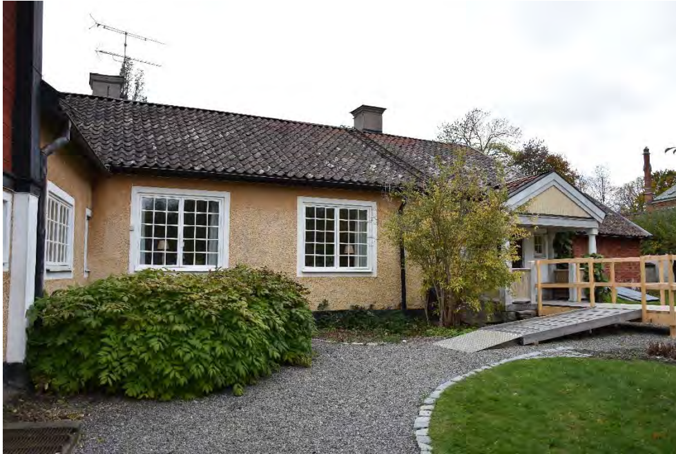
Figur 13. Befintlig stensatt kant och planteringar omkring komministergården före åtgärder.