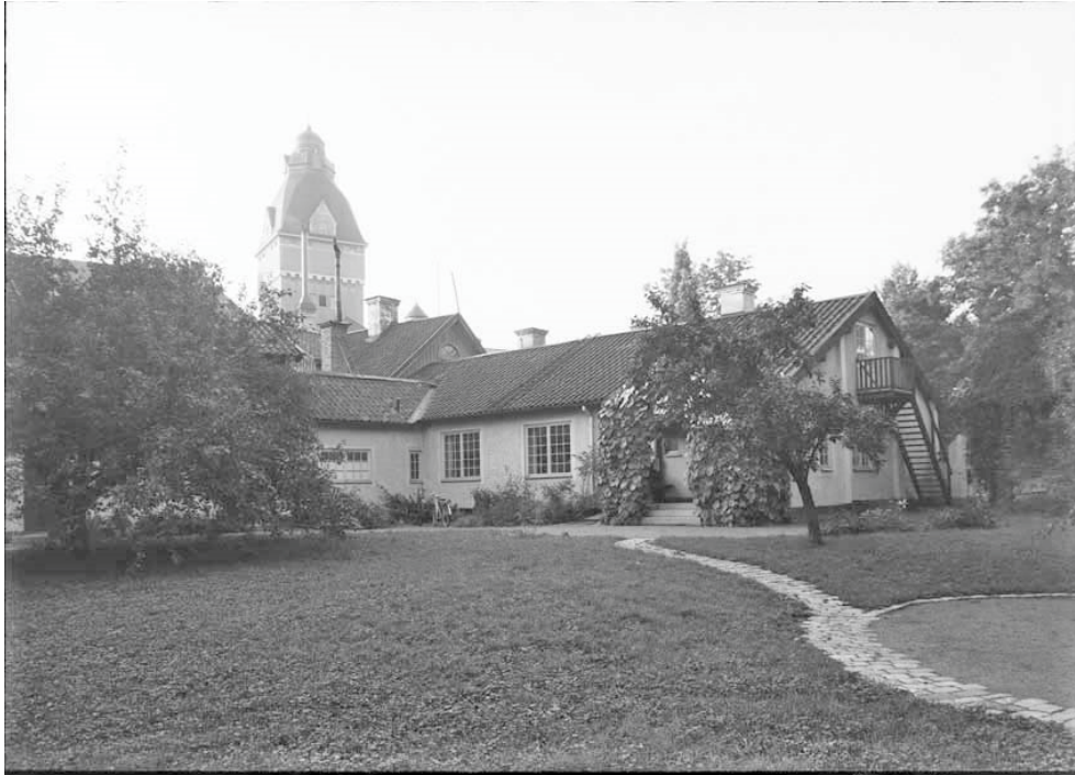
Figur 6. Trädgården under 1930-talet. Sandgångarna har delvis ersatts med stensatta stigar och en sandrundel med stensättning runt om anas i bildens bögra del. Utefter fasaderna har rabatter anlagts och verandan är beväxten med klättrväxter.