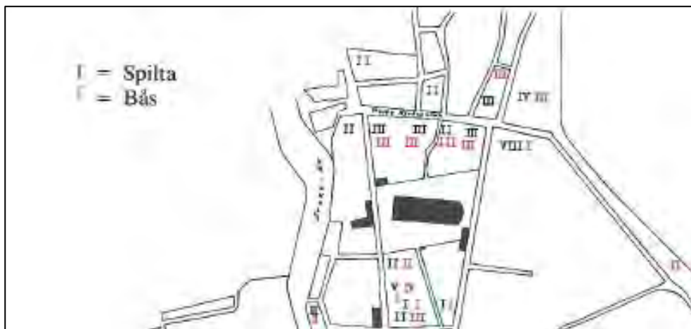
Figur 2. Utsnitt av figur i "Idealstad med förbinder", där antal uppställningsplatser för hästar och kor enligt försäkringsanmälningar 1828-1847 framställs. Man ser här att tomten där komministergården ligger hyser platser för en ko och en bäst.