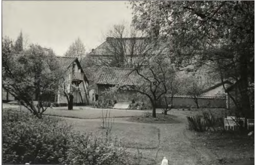
Figur 8. Komministergårdens trädgård på 1940-talet med omfattande gångsystem.