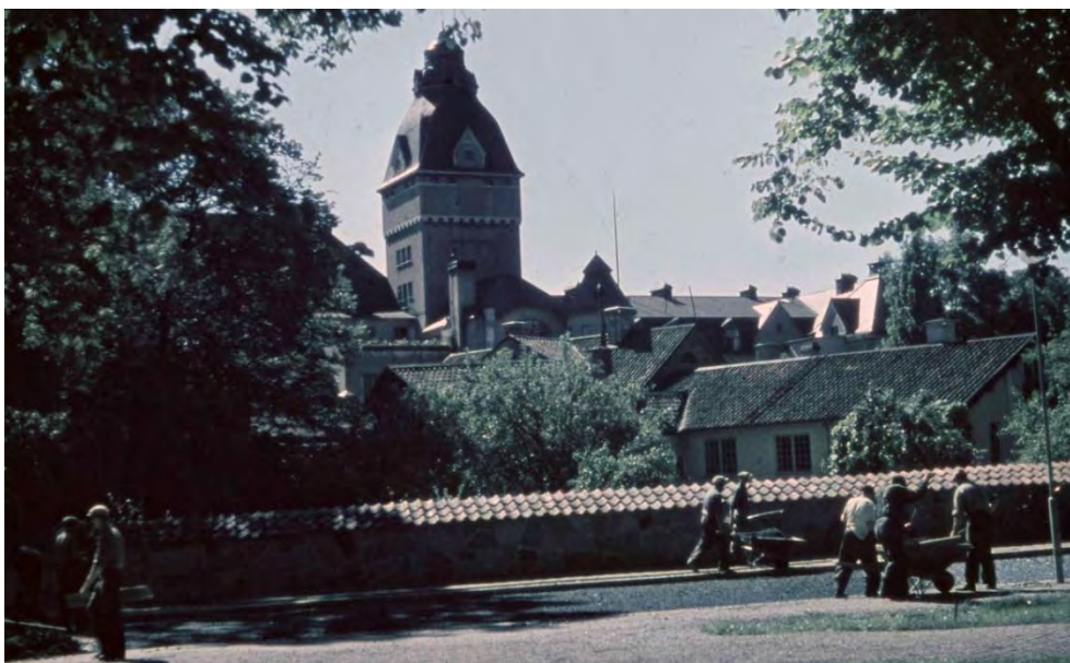
Figur 11. Trädgården sedd från norr med muren tegeltäckt. Möjligen vid byggnandet av Biskopsgatan.