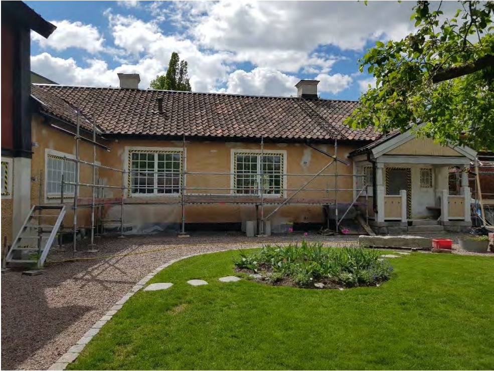
Figur 29. Trampstenar genom börnet.