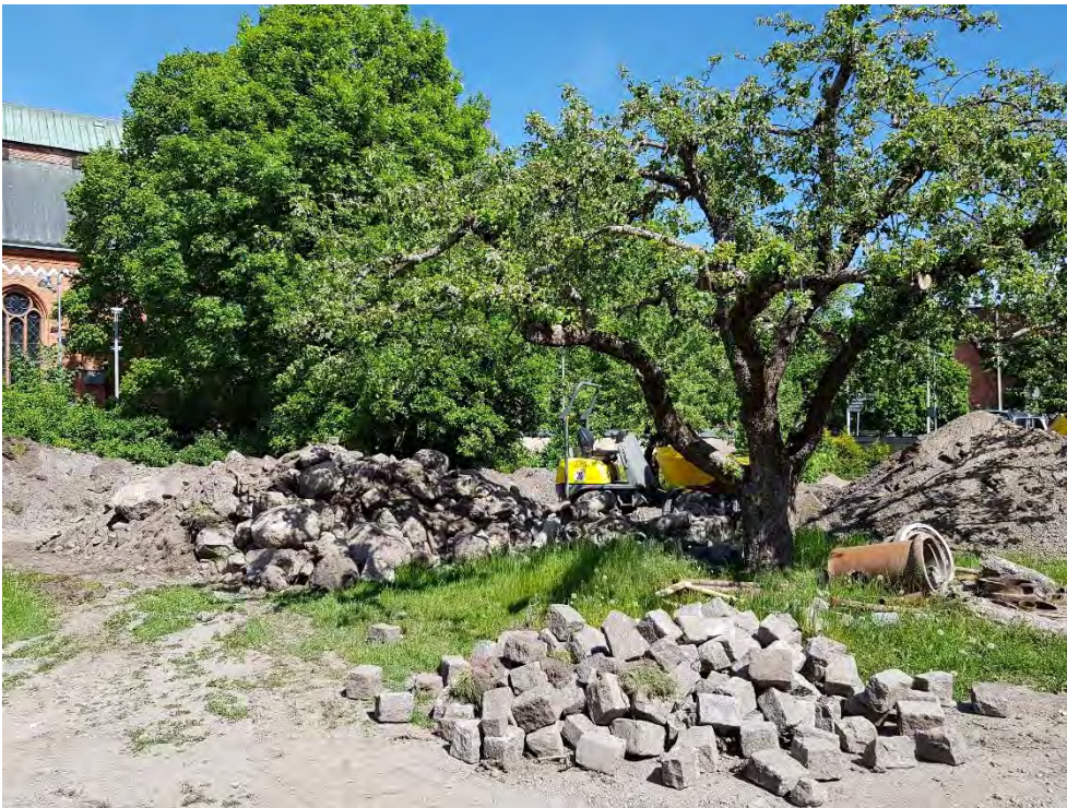
Figur 22. Pågående arbete.