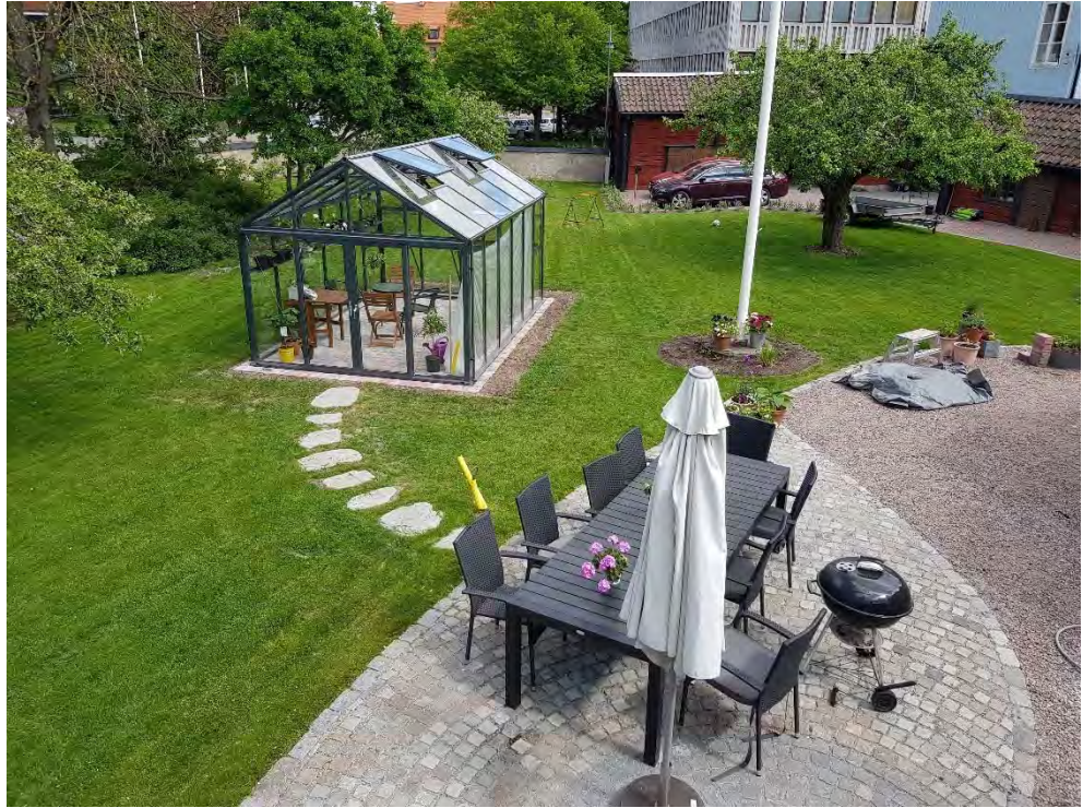
Figur 27. Ny stensatt uteplats samt växthus.