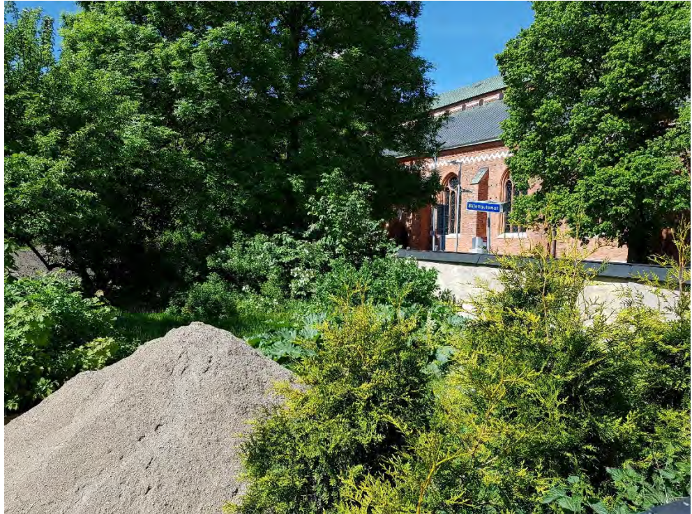
Figur 23. Tujan i förgrunden har tagits bort i samband med arbetet i trädgården.